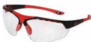
Schutzbrille, klare Gläser