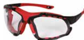
Sicherheitsbrille mit abnehmbarer Schutzbrille